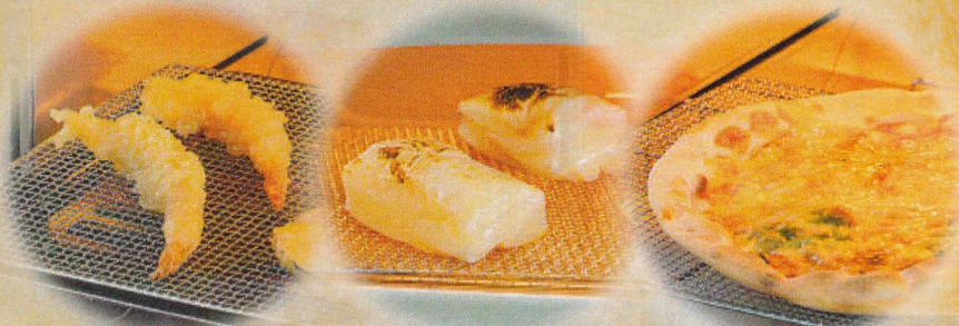
天ぷらをサクサクに温める