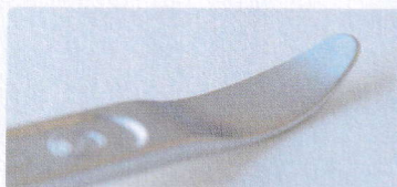
絶妙なカーブを描くベントタイプ