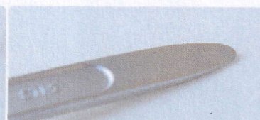
どこにでも入れやすいストレートタイプ